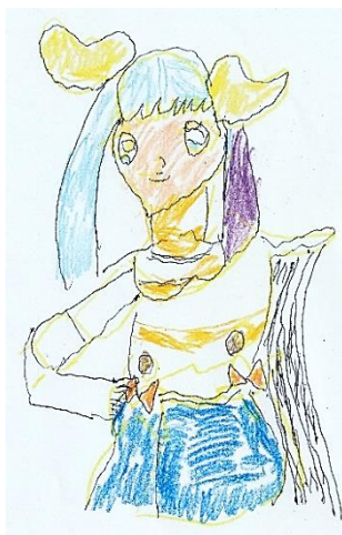
◆キュアスカイ HK プリキュアに行きたい。

◆私の作ったビーズの星が、かわいいヘアアクセサリーになりました。 ここまでかわいくできたのは、想像以上です。作った側としてもこのように利 用してくれて嬉しいです。星が活きた。