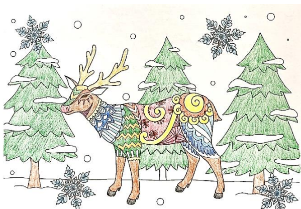
あけましておめでとうございます 今年もよろしくお祈りします CK