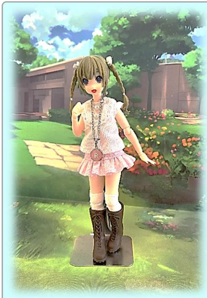
アサルトリリィのライムちゃんの洋服を手縫いで作りました。アクセサリーも手作りです。SH